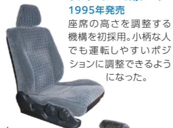
ホンダ CIVIC用シート 1995年発売 座席の高さを調整する機構を初採用。小柄な人でも運転しやすいポジションに調整できるようになった。

人によって感じ方の異なる快適さや疲労度などの官能性能を定量化し、人間工学に基づいた研究を重ね、快適姿勢の独自理論を製品に反映するなど「快適で疲れにくい」シートを追求し続けています。