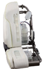
Health Care Seat シートが乗員の姿勢をセンシングし、一人ひとりに合った最適な姿勢を検知。内蔵されたエアデバイスが筋肉をほぐし、骨盤から姿勢をサポート。

大きな変革期を迎えた自動車業界において、自動車に求められる機能や価値は刻々と変化しています。そのような中、これまでのシートやドア単品での開発にとどまらず、自動車の車室内空間を一括でコーディネート可能な「内装システムサブライヤー」を目指し、他企業との提携や共同開発を駆使して、新たな価値創出に取り組んでいます。