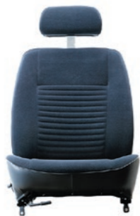
ホンダ 初代CIVIC用シート 1972年発売

ティ・エス テックにとって四輪車用シートづくりの原点ともいえる、ホンダ初代CIVIC用シート。表皮の縫い目破れや、当時は日本人のみを想定して設計したことで、極端に大きな体格の方が乗るとシートフレームが変形するなどトラブルが頻発しました。こうした、トラブルを即座に社内共有し迅速に改善するシステムは、現在でも活かされており、当時の苦い経験が品質への強いこだわりへと受け継がれています。