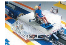
人の身体を守る構造を追求

衝突時の衝撃を忠実に再現する「ダイナミックスレッド試験機」を日本で最初に導入し、あらゆるケースを想定した試験を行っており、完成したシートは各国の自動車安全評価機関でトップクラスの安全性を認められています。