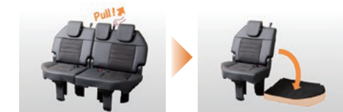
ひもを引くだけで格納できるシート

車室内の限られた空間を最大限に活用するためには、あらゆる用途に応じた多彩なシートアレンジが不可欠です。日々変わりゆくユーザーのニーズを敏感に捉え、さまざまなアイデアを高い技術力で実現しています。