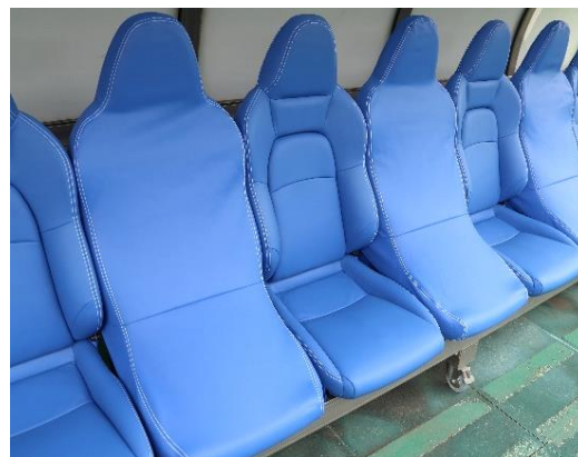
FLEST®を用いたシートカバー

2008年、当社は国際的な大会も多く開催される本スタジアムにおいて、選手が休憩時にしっかりとコンディションを整え、より白熱した試合を繰り広げられるようにと願い、ヒーター機能を内蔵したシート85脚を寄贈しました。