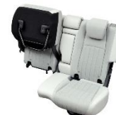
チップアップ (座面跳ね上げ) ※左右独立可能