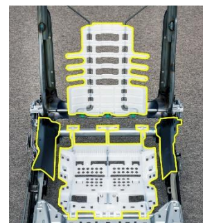
面支持構造を実現する樹脂マット（黄色枠）